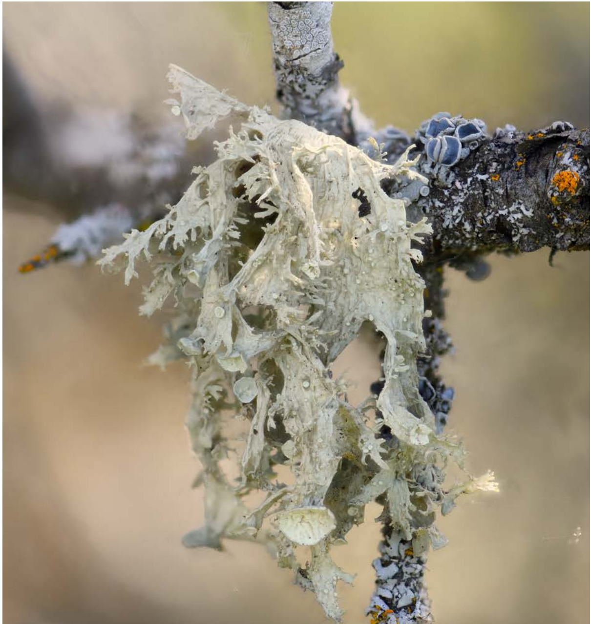
Die Chinesische Astflechte Ramalina sinensis , eine kritisch gefährdete Art