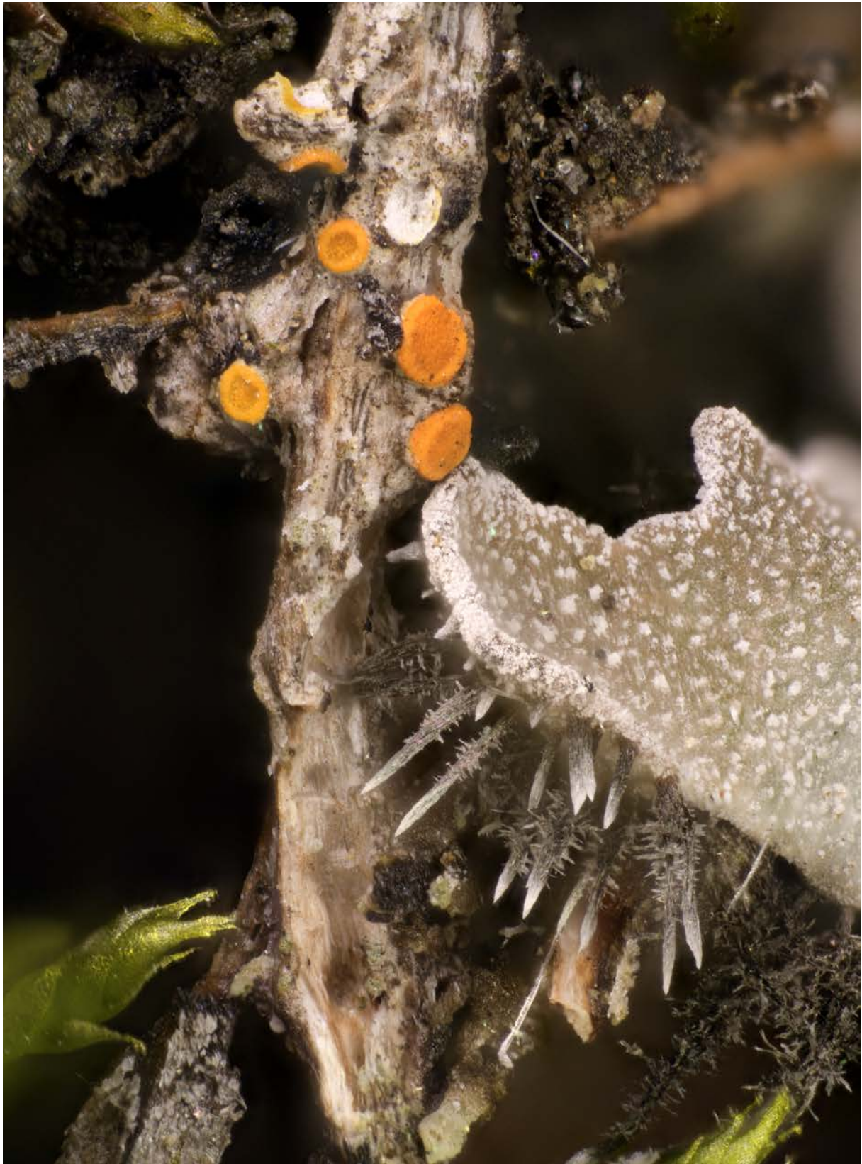
Abbildung 7: Caloplaca raesaenenii , auf einem abgestorbenen, verholzten Pflanzenstängel. Daneben wächst Physconia muscigena .

Stofer S., Scheidegger C., Clerc P., Dietrich M., Frei M., Groner U., Keller C., Meraner, I., Roth I., Vust M., & Zimmermann E. (2019): SwissLichens - Webatlas der Flechten der Schweiz (Version 3 vom 9. 9. 2024). www.swisslichens.ch