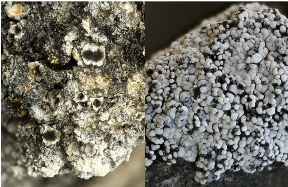
Abbildung 4: Gyalidea asteriscus (EN, links) und Toninia toniniana (NE, rechts) sind zwei seltene Arten von kalkhaltigen Trockenstandorten.

Gyalidea asteriscus konnte trotz intensiver Nachsuche nur an einem Ort gefunden werden: Eine erdinkrustierte Felsrippe an einem Wegrand. Der Fundort ist sehr exponiert. Bei künftigen Arbeiten am Weg sollte das Vorkommen wirklich geschont werden. Es handelt sich um einen der wenigen Funde in der Schweiz und im Kanton Graubünden wurde diese Art letztmals von G. L. Theobald zwischen 1853 und 1859 gefunden (Stofer et al. 2019). Falls die Sicherheit des Vorkommens nicht garantiert werden kann, sollte allenfalls eine Umsiedlung des Vorkommens durch einen Spezialisten vorgenommen werden. Dort wurde ebenfalls Heppia adglutinata (VU) und die seltene Toninia toniniana (Abbildung 4) gefunden.