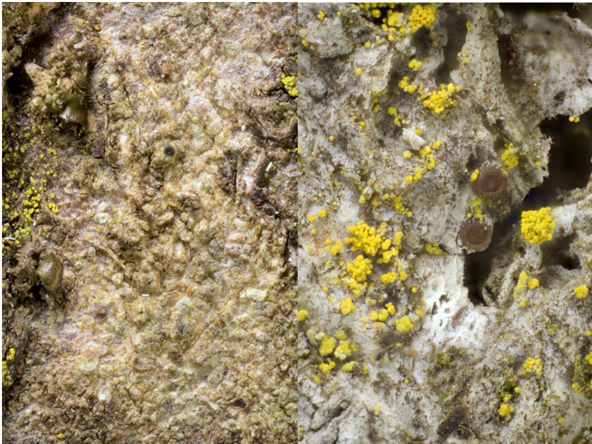
Abbildung 3: Thelenella modesta (CR, links) und Gyalecta fagicola (VU, rechts) wachsen an einer kräftigen Buche in einem lichten Wald.

Die zweite vom Aussterben bedrohte Art, Thelenella modesta , wurde an grossen Ästen einer kräftigen Buche gefunden. Diese Art ist äusserst unauffällig und nur bei gezielter Suche zu finden. Der Trägerbaum sollte unbedingt erhalten werden, auch weil am Stamm mit Gyalecta fagicola zusätzlich eine verletzbare (VU) Art vorkommt (Abbildung 3). Als weitere Massnahmen kann allenfalls versucht werden, in der Umgebung des Trägerbaums Bergahorn und Buche zu fördern.