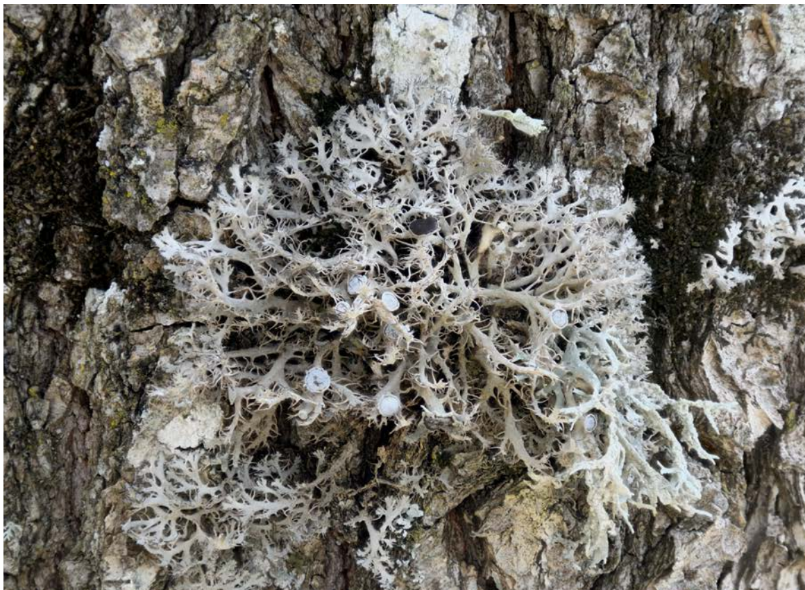
Abbildung 5: Anaptychia ciliaris (VU) eine charakteristische Strauchflechte in lichten Wäldern und an freistehenden Bäumen.

Unter den verletzlich (VU) Arten ist Anaptychia ciliaris an den Eichen im Wytwald oberhalb Tit zu erwähnen (Abbildung 5). Die Art hat zwar in vielen Gebieten einen starken Flächenrückgang verzeichnet. In etwas lichterem Laubwäldern ist die Art aber oft schön entwickelt und häufig. Dies gilt auch für das Untersuchungsgebiet, wo die Art im Wytwald oberhalb Tit und an kräftigeren Bäumen in verschiedenen Feldgehölzen vorkommt.