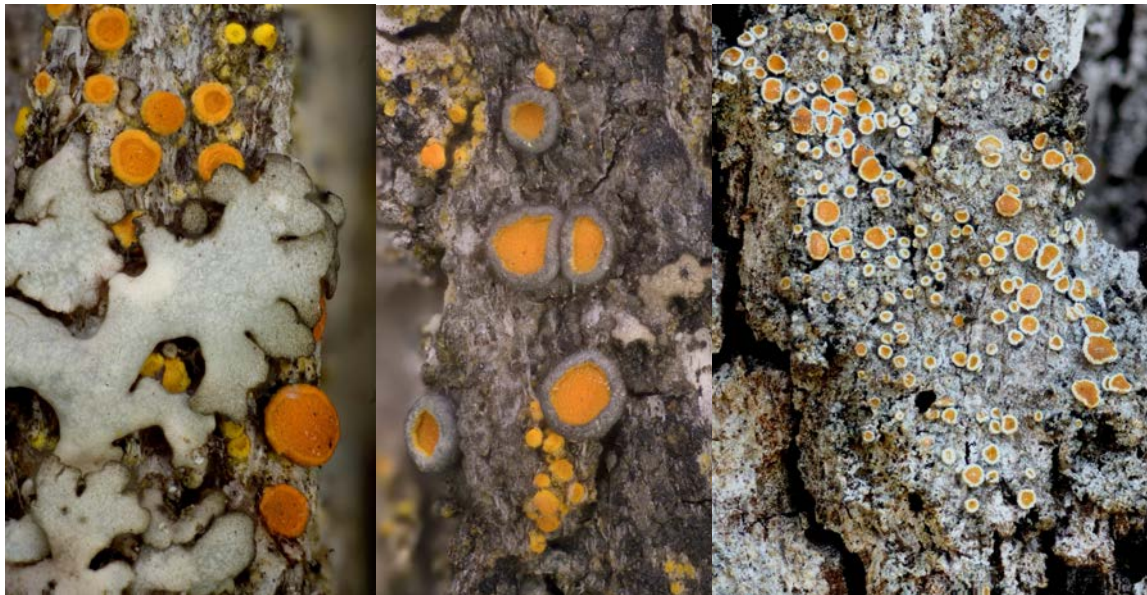
Abbildung 6: Vertreter der Gattung Caloplaca wie C. pyracea , C. haematites und C. monacensis (alle NE).

Aber auch unter den Arten, welche bisher in keiner Roten Liste beurteilt wurden (NE) oder deren Datengrundlage für eine Beurteilung zurzeit ungenügend ist (DD) befinden sich mehrere interessante und für das Untersuchungsgebiet charakteristische Arten. Darunter verschiedene Arten der Gattung Caloplaca wie C. pyracea , C. haematites und C. monacensis , letztere an einer der mächtigsten Eichen oberhalb von Tit (Abbildung 6)