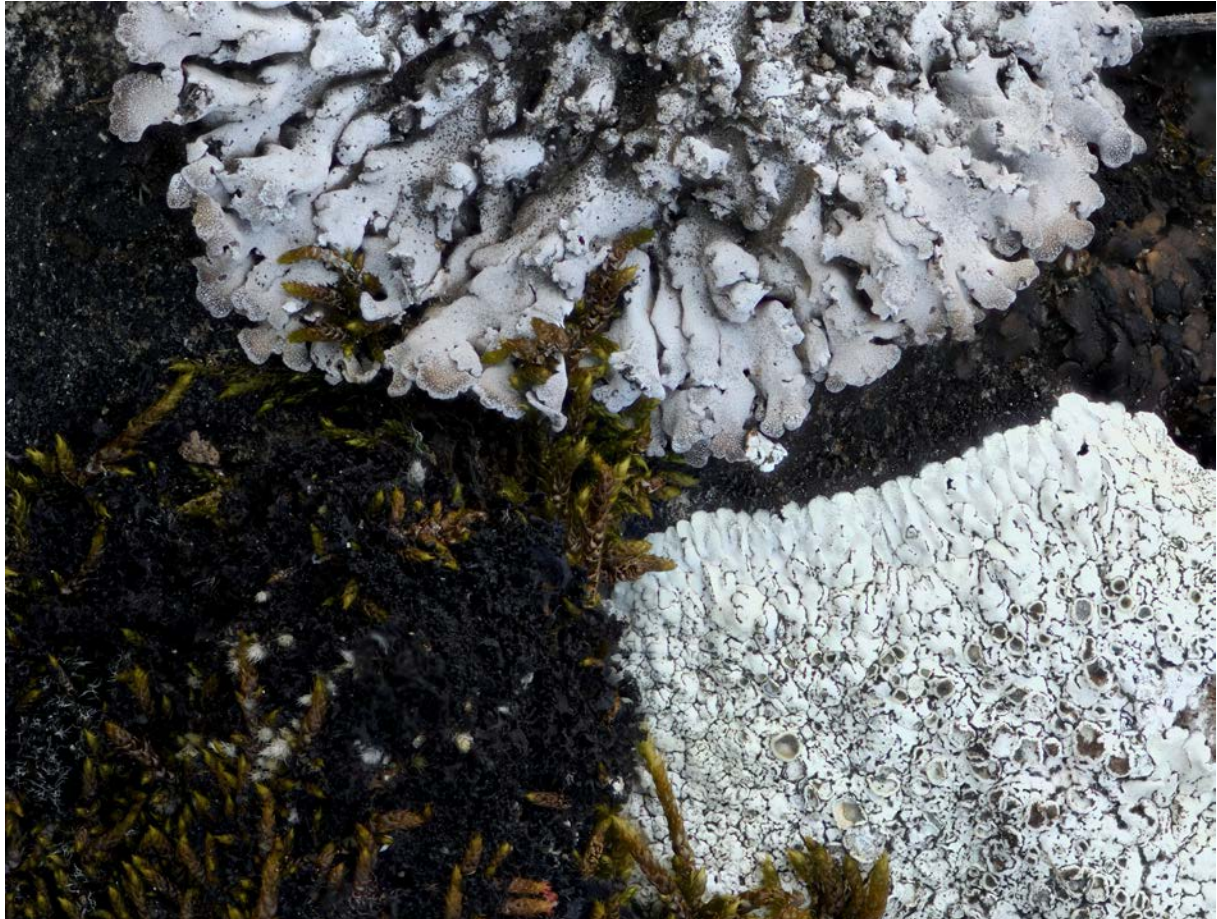
Abbildung 2: Lecanora valesiaca (unten rechts) und Physconia muscigena (oben), zwei charakteristische Flechten sonnenexponierter Felsflächen der Trockenwiesen und -weiden unterhalb von Feldis.

Lecanora valesiaca und Aspicilia praeradiosa zwar von mehreren Stellen aus dem Kanton Wallis her bekannt ist, aus dem Kanton Graubünden wurden die beiden Arten jedoch bisher nur von G. L. Theobald im Jahre 1858 nachgewiesen, bevor sie jetzt in Feldis erst in diesem Jahr wieder gefunden wurden (Stofer et al. 2019).